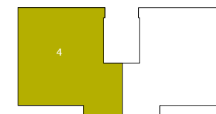
Lageplan Wohnung 1. OG