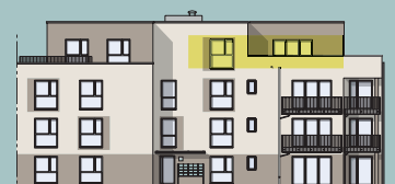
Haus 2.2 - Ansicht Süd