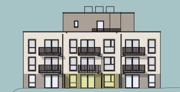
Haus 2.1 - Ansicht West